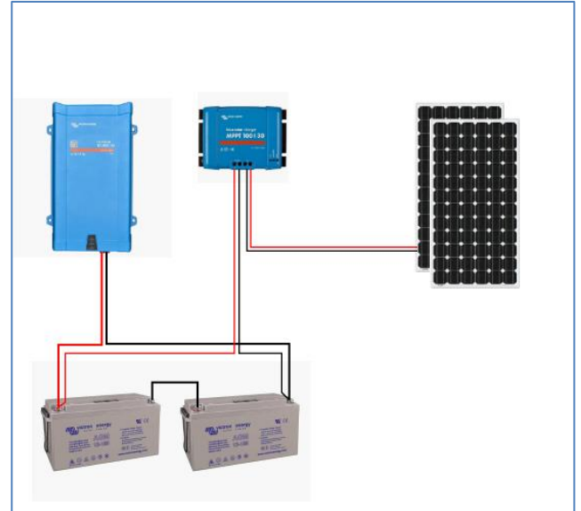
Installation 24VDC / 230VAC